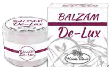
Balzám - 30 ml kód 300030

Složení: bambucké máslo, mandlové máslo, kakaové máslo, extrakt z aloe vera, kokosový olej.