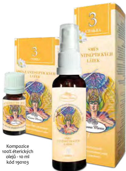
Kompozice 100% éterických olejů - 10 ml kód 190103

Orgány: slinivka-slezina, játra, žlučník, žaludek, tenké střevo.