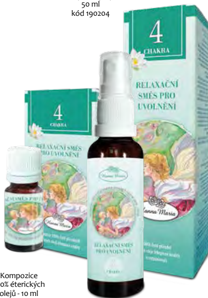
Kompozice 100% éterických olejů - 10 ml kód 190104