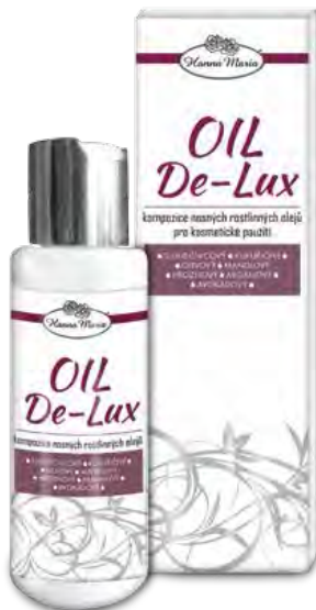
Olej - 100 ml kód 300100

SLUNEČNICOVÝ OLEJ KUKUŘIČNÝ OLEJ OLIVOVÝ OLEJ MANDLOVÝ OLEJ HROZNOVÝ OLEJ ARGANOVÝ OLEJ AVOKÁDOVÝ OLEJ